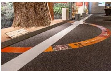
①展示フロア全体に点字ブロックを敷設<JICA 横浜・海外移住資料館リニューアル>

三井住友銀行では、「SDG s 推進融資」により、本業を通じ、SDG s が達成される社会の実現に貢献をしております。