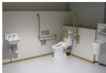
②公共施設のアクセシブルトイレ 公平に尊厳をもって機能的な環境を整える