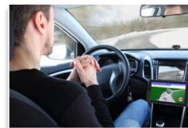
運転の自動(自律)化