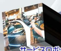
サービスロボット