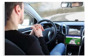
運転の自動(自律)化