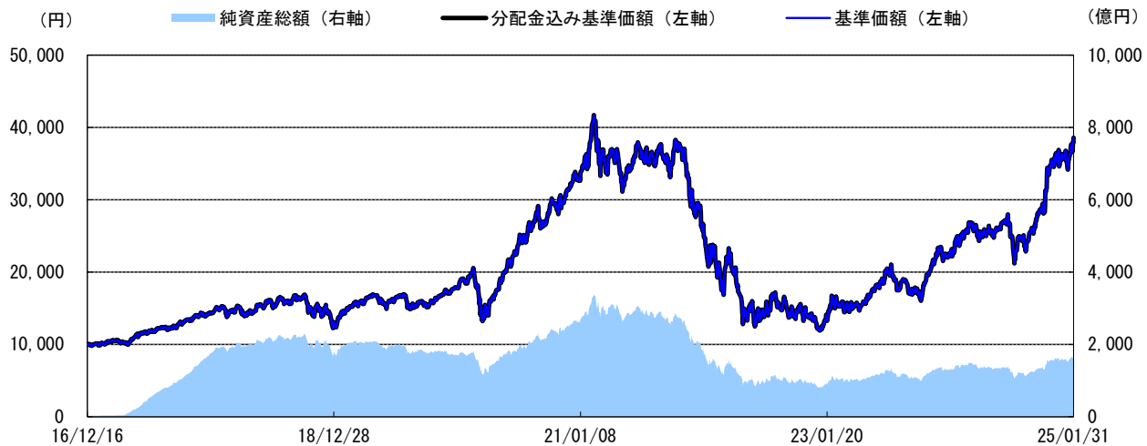
＜基準価額の推移グラフ＞

※分配金込み基準価額の推移は、当ファンドに分配金実績があった場合に、当該分配金(税引前)を再投資したものと計算した理論上のものである点にご留意ください。 ※基準価額は、信託報酬(後述の「手数料等の概要」参照)控除後の値です。