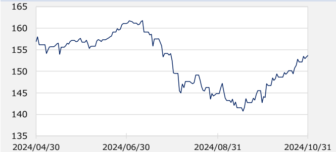
円/アメリカドル（円）