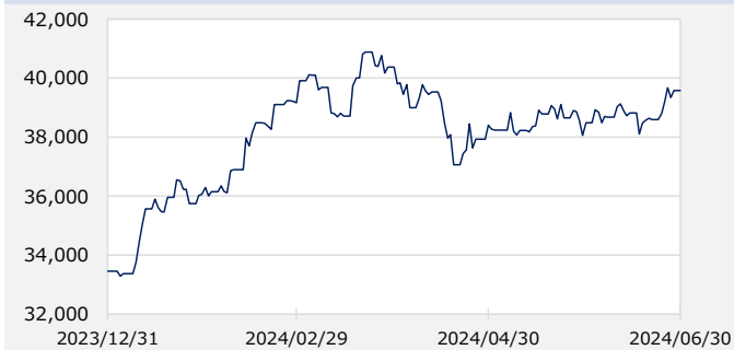
日経平均株価 (日経225) (円)