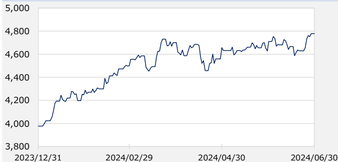
TOPIX (東証株価指数、配当込み)