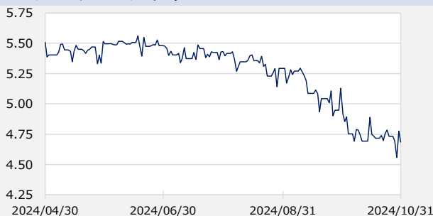
アメリカドルヘッジコスト (%)