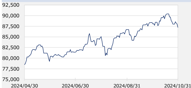
ダウ・ジョーンズ工業株価平均 (税引後配当込み)