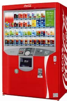
写真①「ecoる／E40」自動販売機