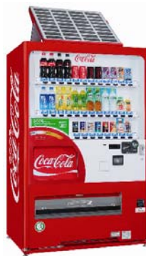
写真②「ecoる／ソーラー」自動販売機