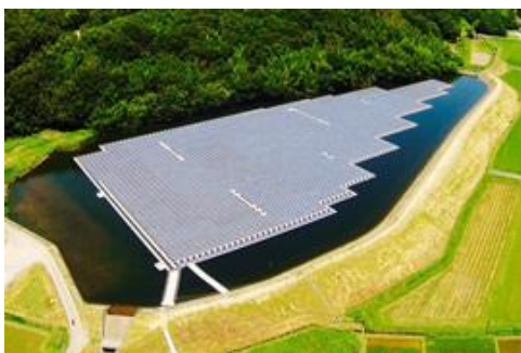
水上での太陽光発電 「小野市太陽光発電所」