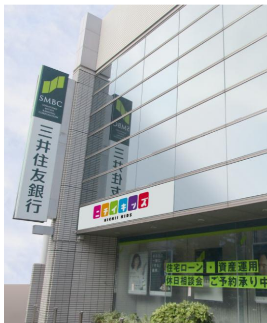
三井住友銀行雪ヶ谷支店