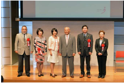
東京都女性活躍推進大賞 授賞式の様子