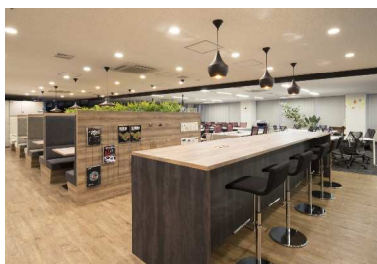
コミュニケーションを 促進する多様な空間を 備えたオフィス

三井住友銀行では、「S M B C 働き方改革融資」により、お客さまの働き方改革に向けた取組を、金融を通じて応援してまいります。