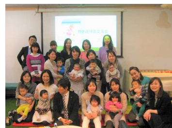
育休復帰者交流会