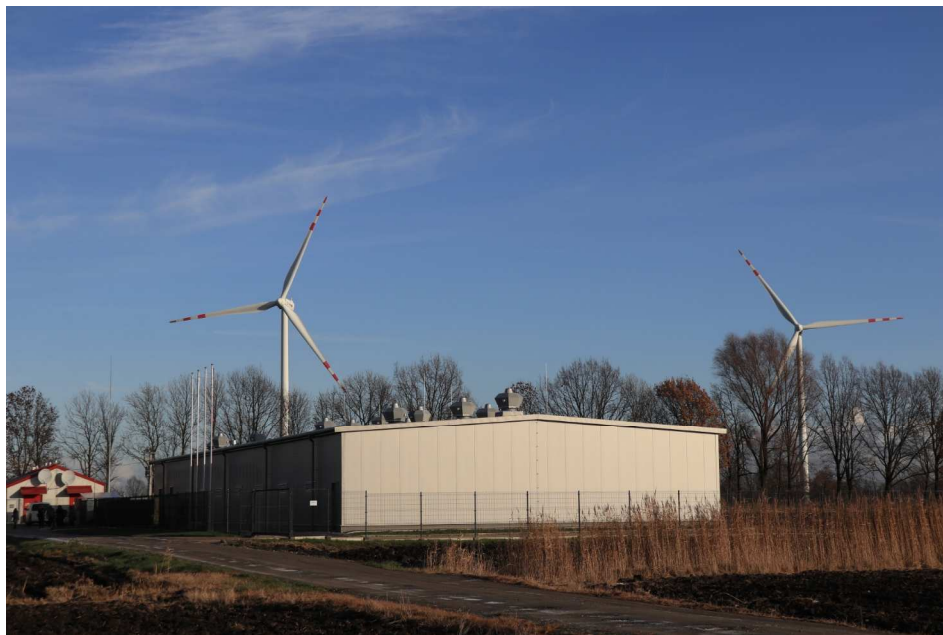
図1 ピストラ風力発電所に併設したハイブリッド BESS 建屋

今回導入したハイブリッド BESS は、高出力のリチウムイオン電池と大容量の鉛蓄電池を組み合わせることにより、高性能と低コストを両立させたポーランド最大規模の蓄電池システムです。実証運転により、風力発電の短期的な変動を緩和する機能や、需給バランスを調整するために必要な予備力を提供する機能など、その有効性を検証します。