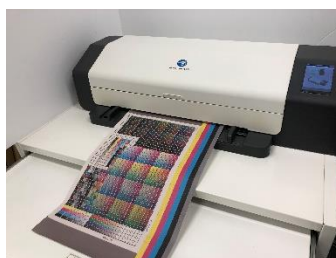
卓越した色安定性を 担保する色管理