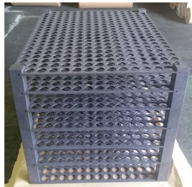
C/C コンポジット製熱処理用治具。 金属製と比べて重量は 1/4 以下と 省エネ。