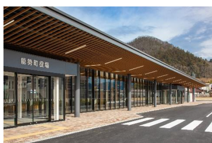
能勢町庁舎施工建物：内装材に能勢産杉材や檜材を使用し、木の香る温かみのある庁舎です。

三井住友銀行では、「SDG s 推進融資」により、本業を通じ、SDG s が達成される社会の実現に貢献をしております。