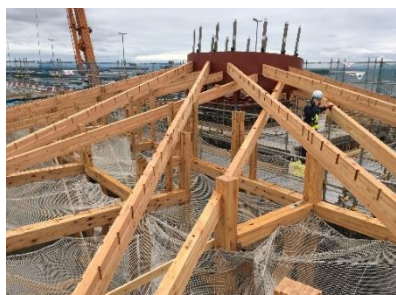
泉大津パーキングエリア休憩所 施工中建物：木で囲まれた柱のない広々とした空間を実現しています。BIM を活用中です。