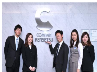
関西勤務の若手社員 本社玄関受付前に集合。