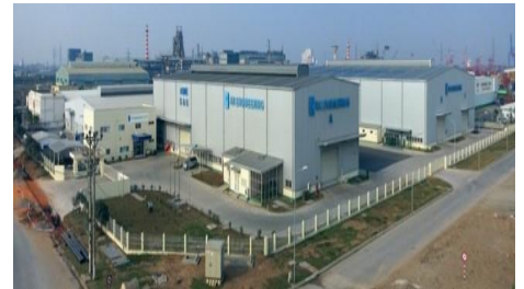
東南アジアの拠点 ベトナム工場