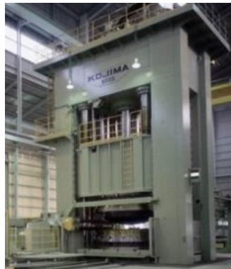
関東工場 9000 トンプレス