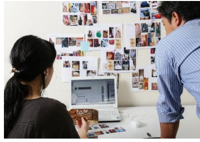
I Tツールを使つての生産性 向上を意識した働き方