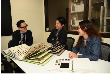
若手社員向けスキルアップ研修