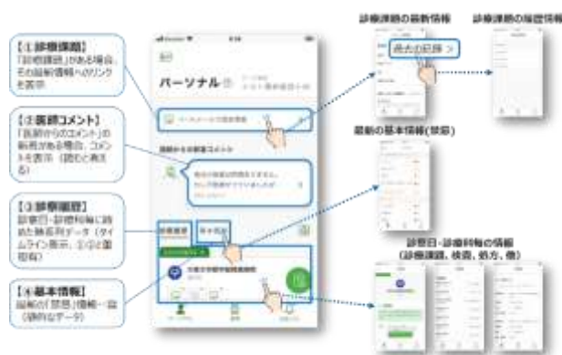
<スマートフォン操作画面イメージ>