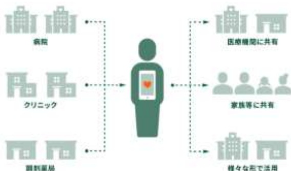
<データ管理・共有・活用イメージ>

ご利用者様の健康・医療データをお預かりし、ご利用者様が安全にデータを管理・共有・活用できるようにすることを目的として、三井住友銀行が開発・運営するスマートフォンアプリです。お預かりしたデータは、共有や提供する相手をご利用者様が選択・決定・コントロールすることができるので、大切なデータを守りつつ、様々なメリットを得ることが可能となります。