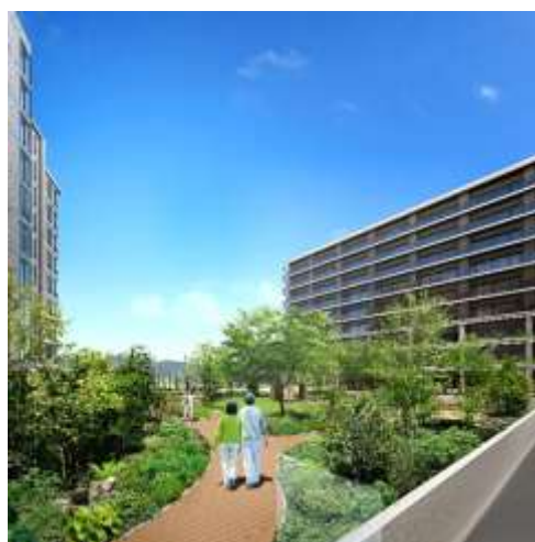
<屋上庭園完成予想イメージ>