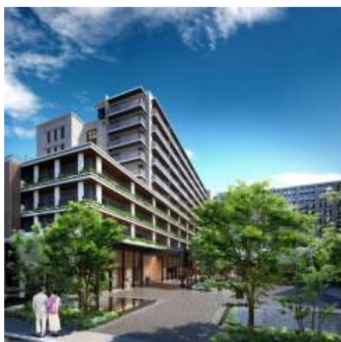
<エントランス完成予想イメージ>